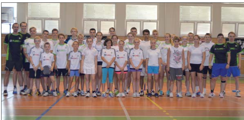
Herní oddílové soustředění - Hořice v Podkrkonoší 2015

(vše bude během sezóny postupně upřesňováno)