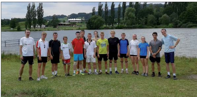
Kondiční soustředění - Horní Branná 2015